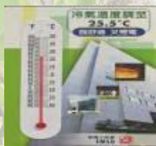
由二零零四年十一月起，政府辦公大樓的室內溫度在夏季設定為攝氏 25.5 度