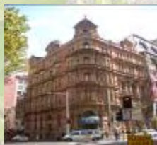
在澳洲悉尼的一幢古典大樓租用地方，作為香港特區的海外辦事處