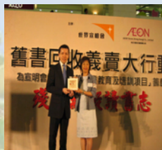
物業管理公司舉辦的環保活動