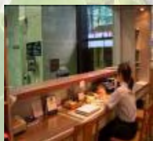
入境事務大樓內的物業管理辦事處