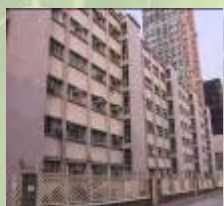
騰出市區內使用率低的部門宿舍，並交回地政總署

與本署環保政策息息相關的，主要包括我們管理的政府產業的使用者，以及負責建築工程、屋宇／機電維修及產業管理的代理。政府產業的使用者包括決策局、部門、宿舍佔用人及市民大眾。我們的工程代理則包括建築署、機電工程署、物業管理公司及地產代理等。