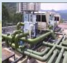
更換梅窩政府合署的氣冷式製冷機，改為安裝懸浮冰晶體製冷機