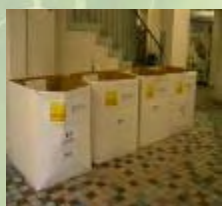
丹拿道已婚警察宿舍推行環保回收計劃, 收集舊衣物及電器用品