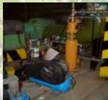
為入境事務大樓加設自動管道清洗系