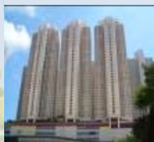
取得油塘油美苑的居屋單位，用作紀律部隊宿舍