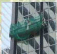
建築署為入境事務大樓的玻璃幕牆進行翻新工程