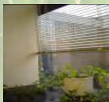
放下窗簾·避免因陽光直 射而令室內溫度上升