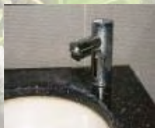
政府辦公大樓洗手間使用感應自動開關水頭