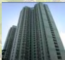
葵蓉苑是其中一座改裝為紀律部隊宿舍的居屋

(1) 香港建築環境評估證書計劃是香港地產建設商會轄下的一項計劃，為發展商、使用者及樓宇管理人員提供有關樓宇的良好環保成效的權威指引和評估方法。這項計劃由環境技術中心負責推行。該中心是獨立的非牟利環保資訊中心，其評審人員會為樓宇進行評估和評定等級，並在評審後向樓宇頒授證書。