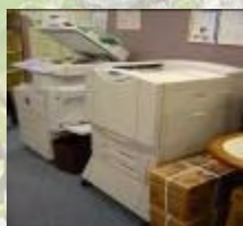
共用的打印機和 影印機均設有環 保紙箱