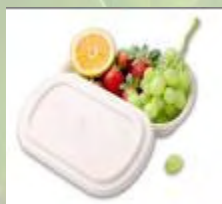
政府食堂必須使用可作生物降解的飯盒提供外賣服務