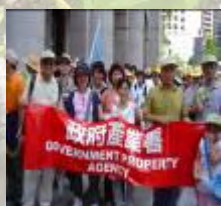
20 名員工參加環保步行活