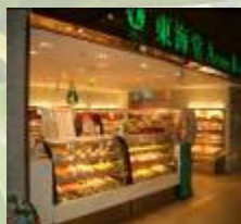
稅務大樓地下出租商舖