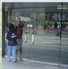
物業管理公司清潔人員的工作情況