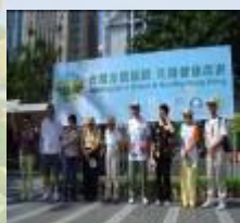
環境保護運動委員會舉辦的世界環境日環保步行活動