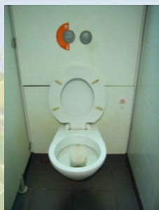
在部分政府辦公大樓裝設的雙掣式沖水 / 節約用水的沖廁水箱